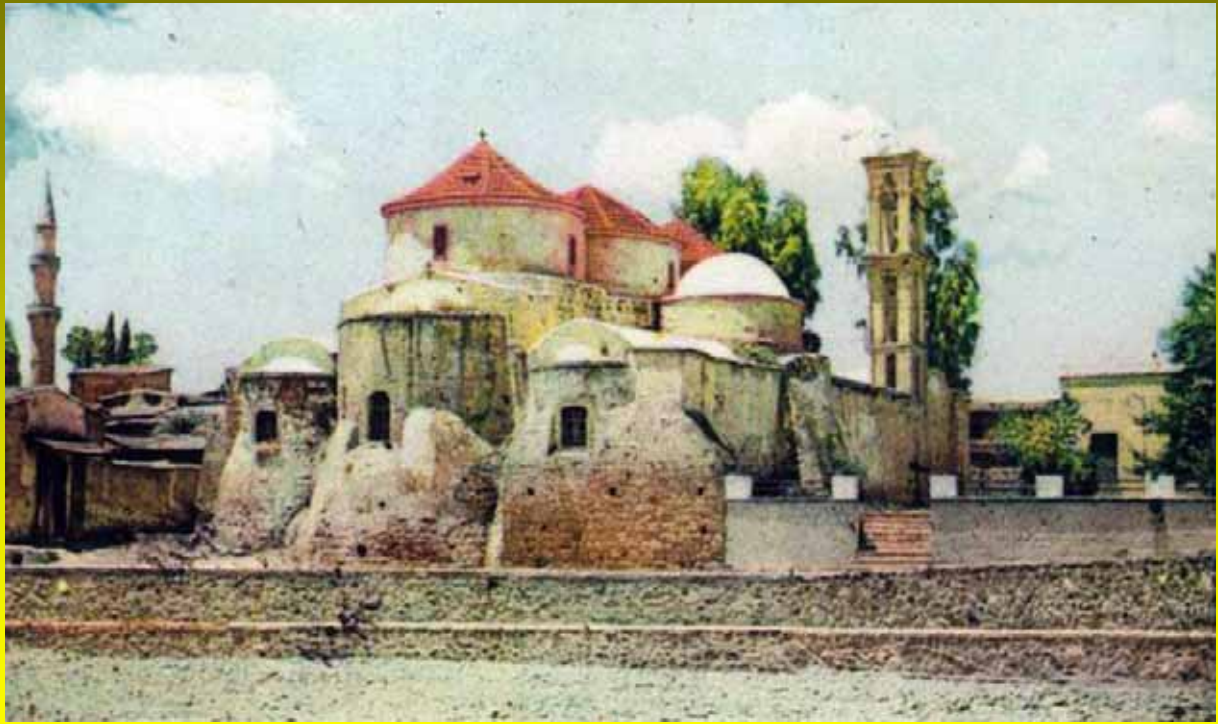
Η Εκκλησία και το Τέμενος της Περιστερώνας