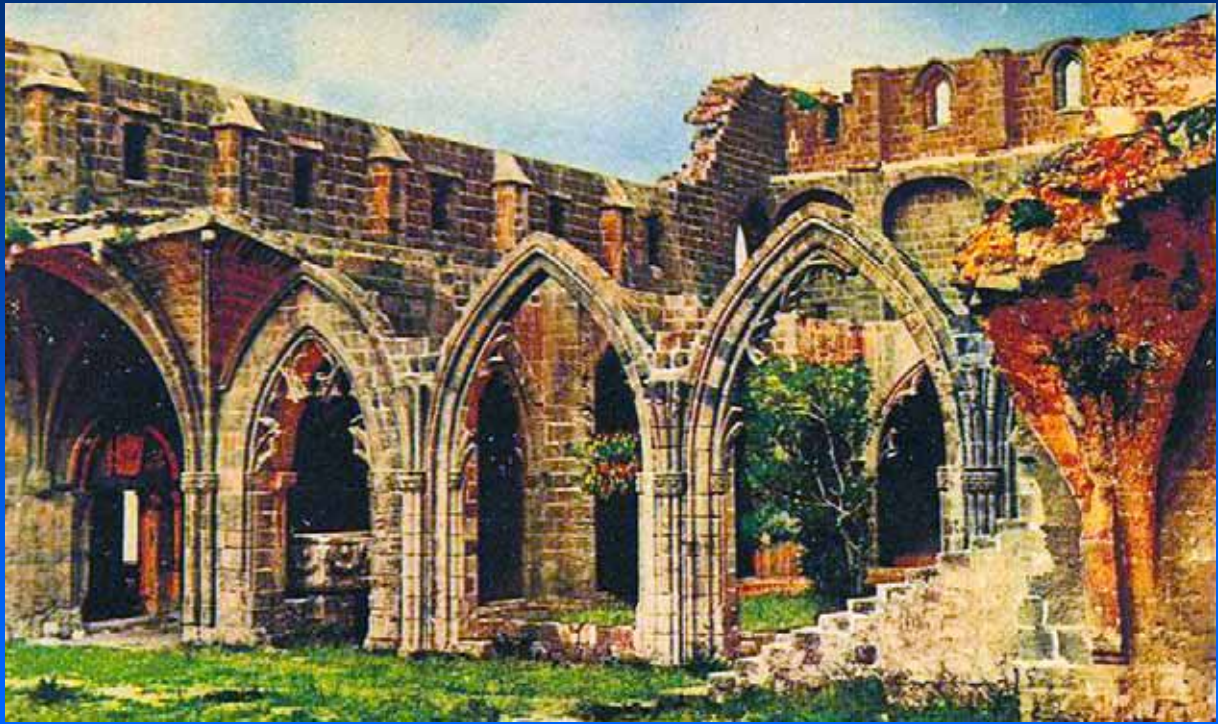
Το Αββαείο του Μπέλλα-Πάις