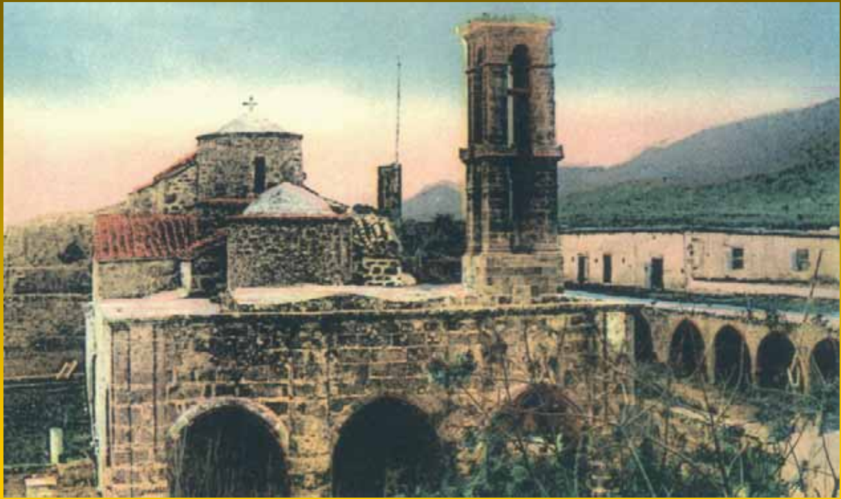
Το Μοναστήρι του Αγίου Παντελεήμονα, Μύρτου