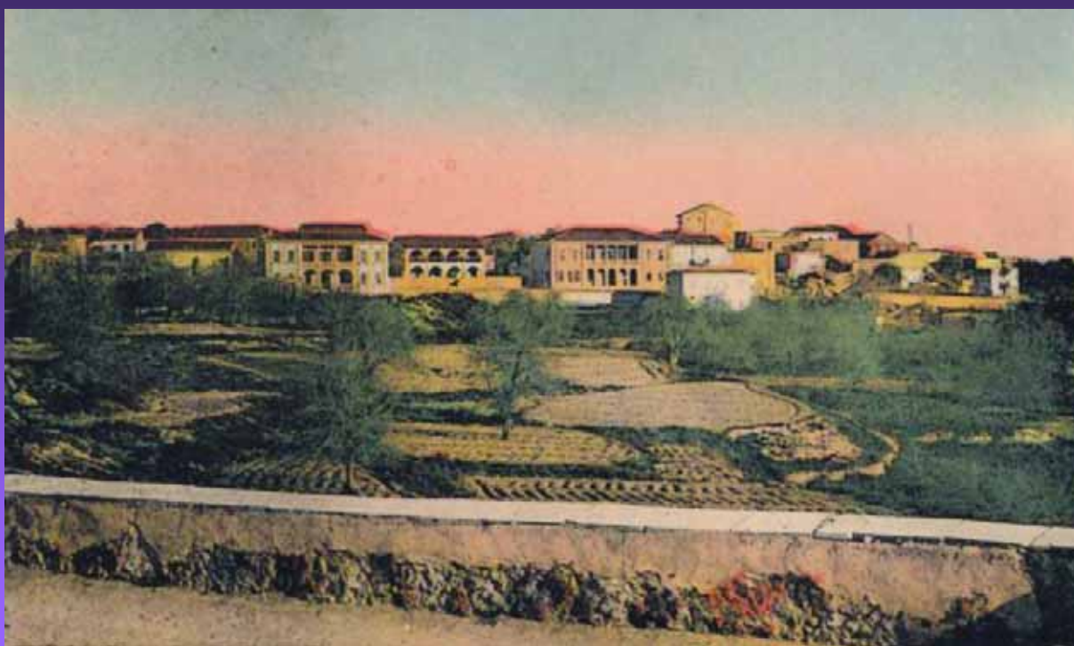
Άποψη της Πάφου