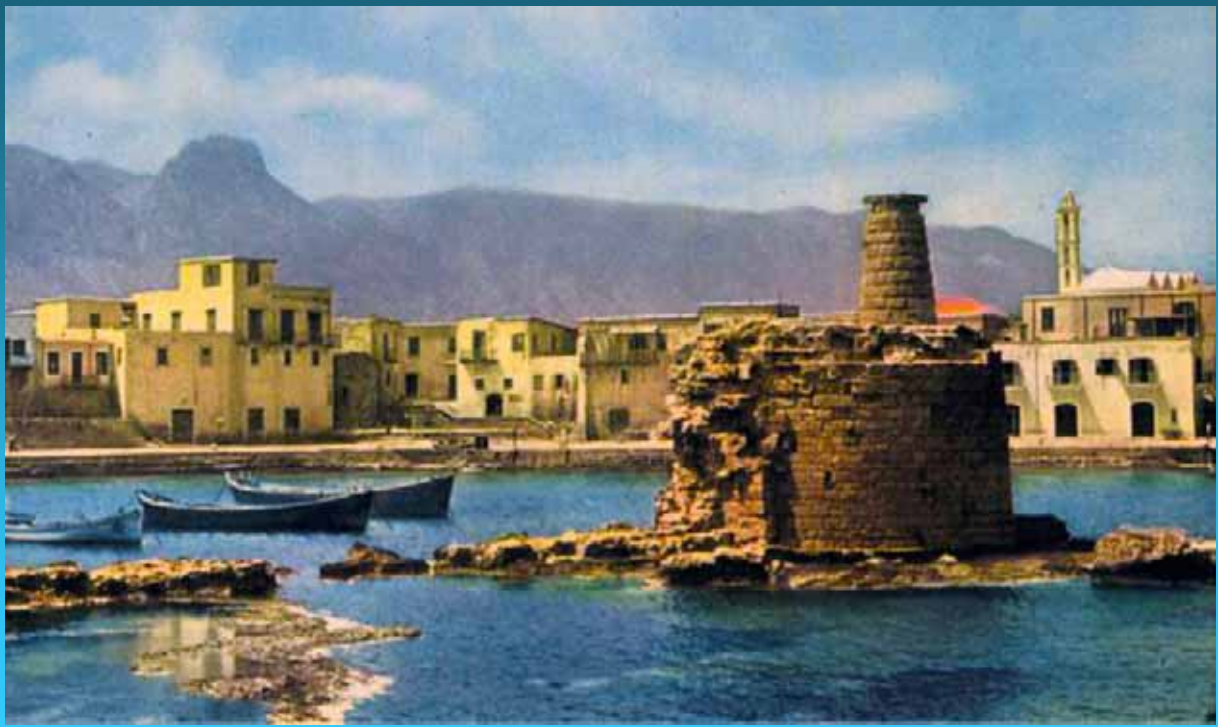
Το Λιμάνι της Κερύνειας