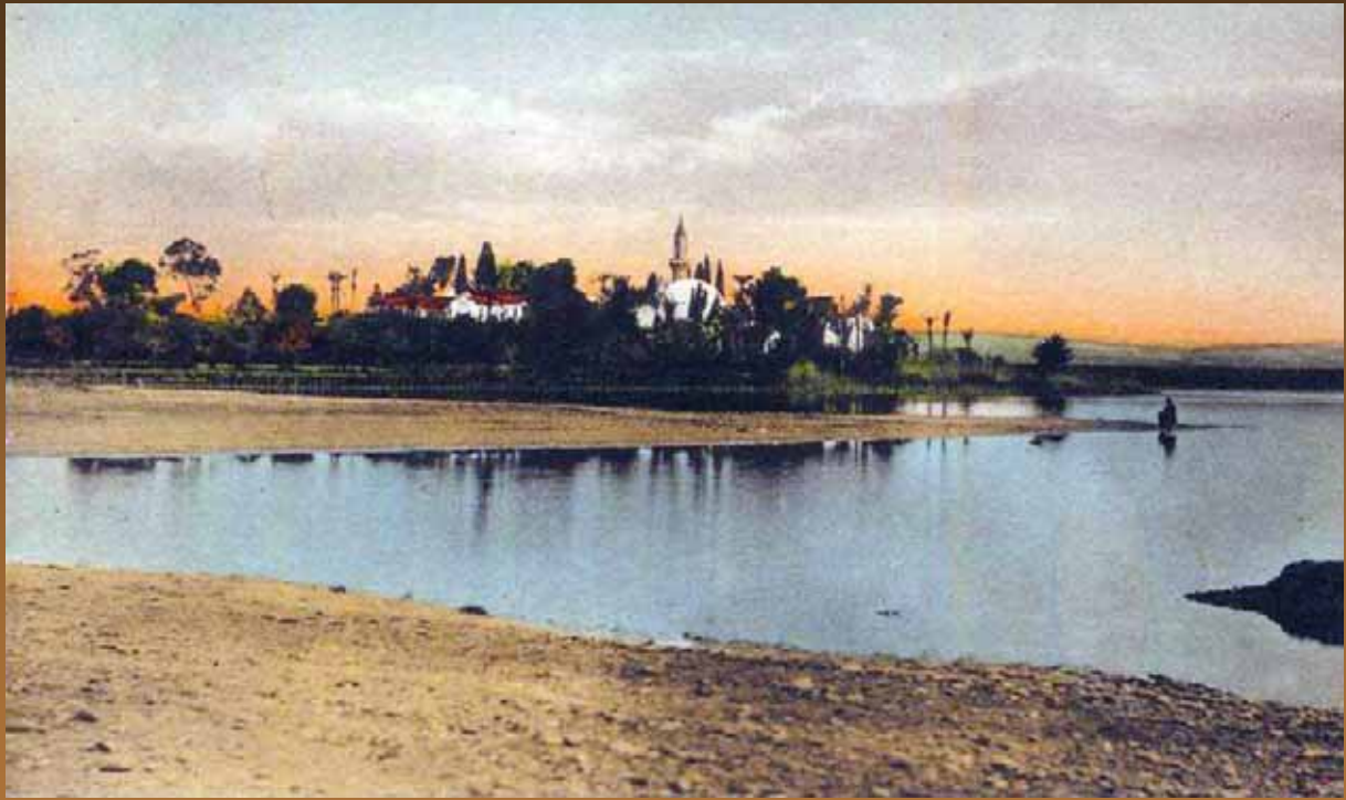
Η Αλυκή της Λάρνακας