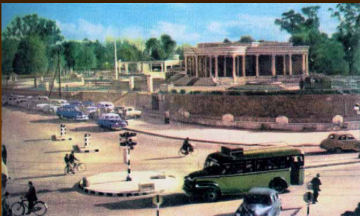
Η Πλατεία Μεταξά (Ελευθερίας), Λευκωσία