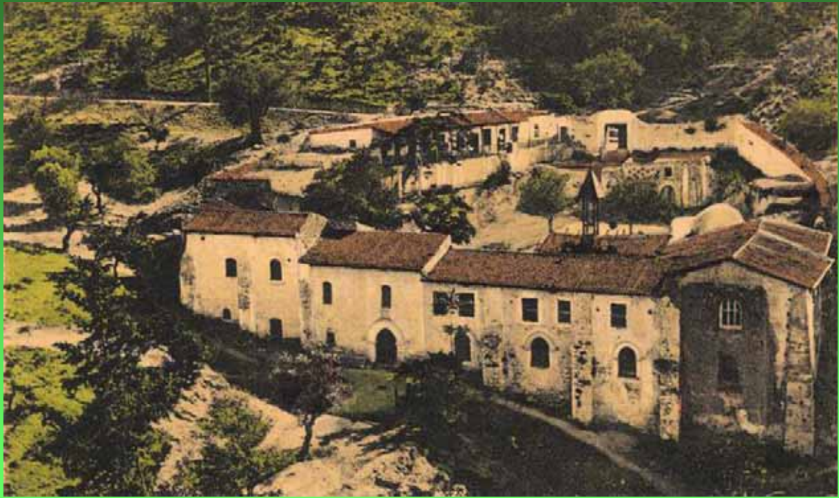
Το Αρμενικό Μοναστήρι του Αγίου Μακαρίου, Χαλεύκα