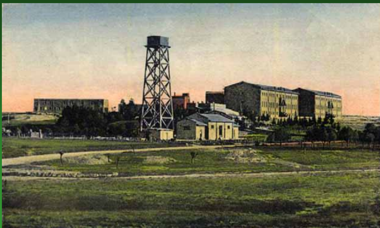
Το Εκπαιδευτικό Ινστιτούτο Μελκονιάν, Λευκωσία