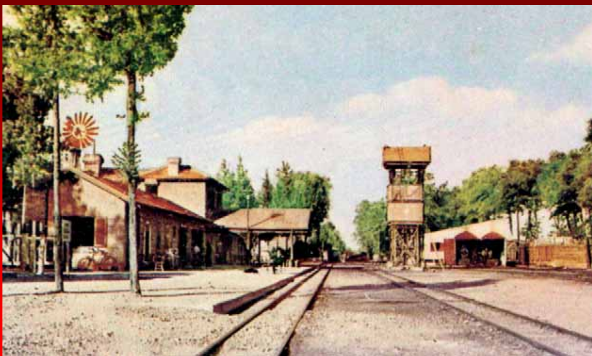
Ο Σιδηροδρομικός Σταθμός της Λευκωσίας